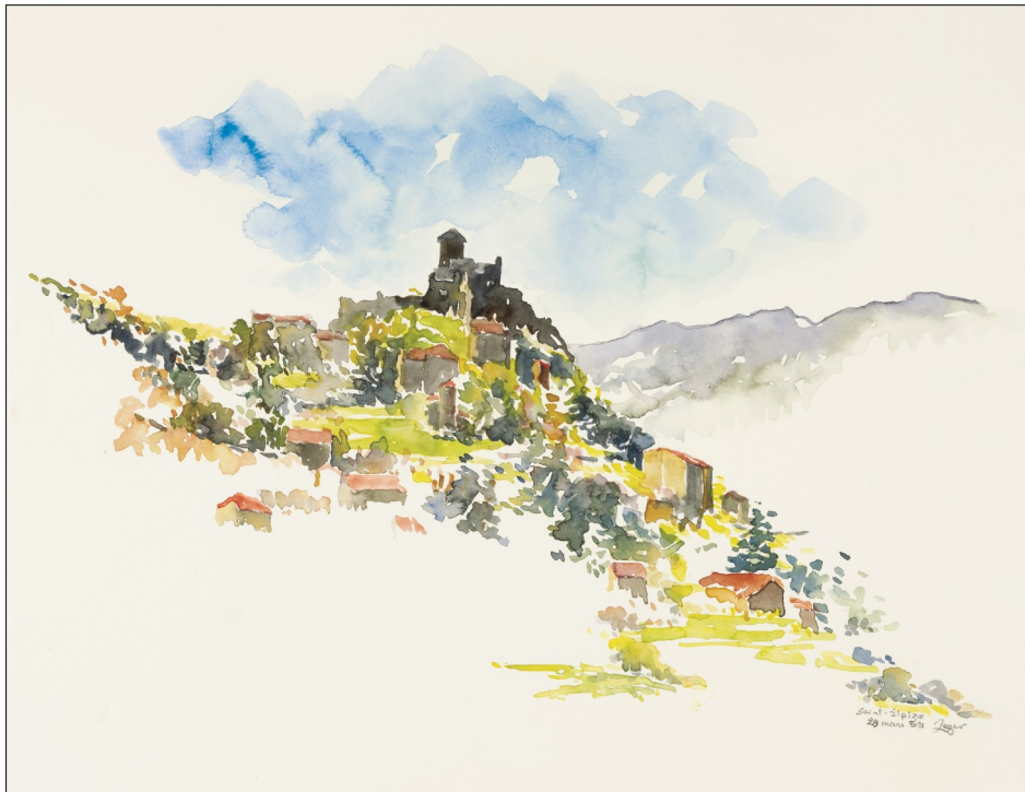
Aquarelle Michel Léger

La Biennale d'Aquarelle de Brioude part en balade à Saint-Ipize , samedi 19 juillet, de 10h à 12h et de 14h à 19h.